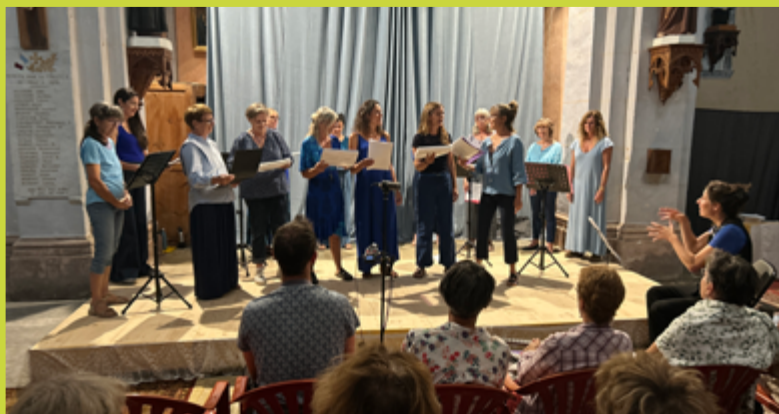
Journées du Patrimoine - Chants occitans