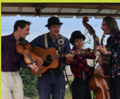
Sunshine in Ohio