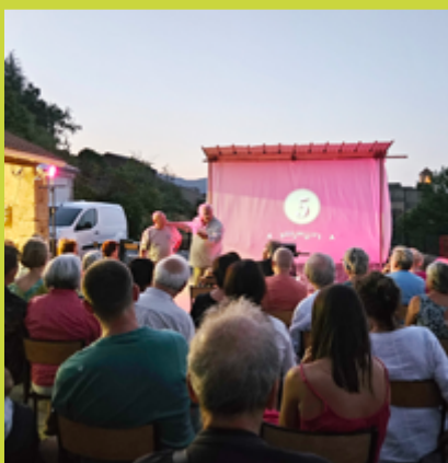
Nuit du cinéma