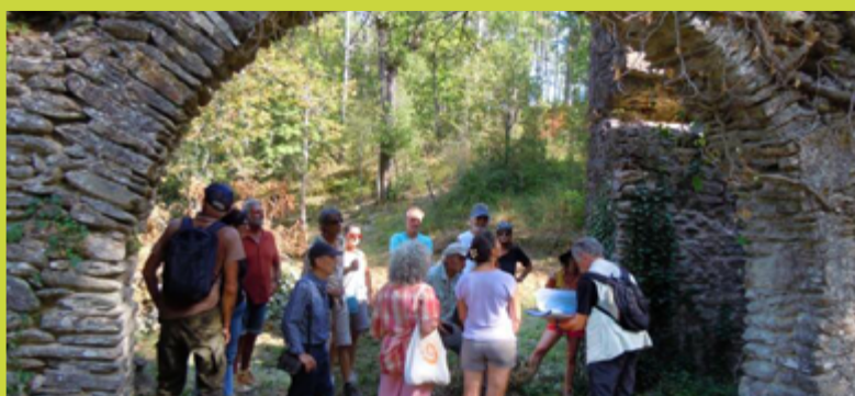
Journées du Patrimoine - Balade à Abeau