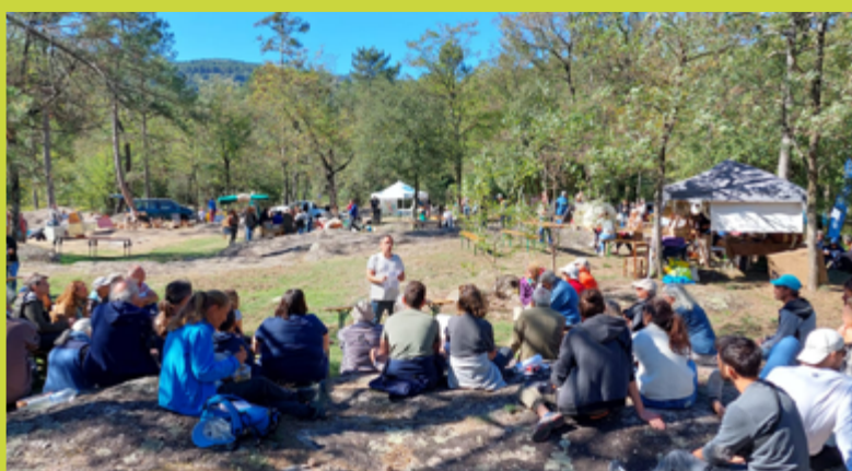
Fête du pin de Salzmänn