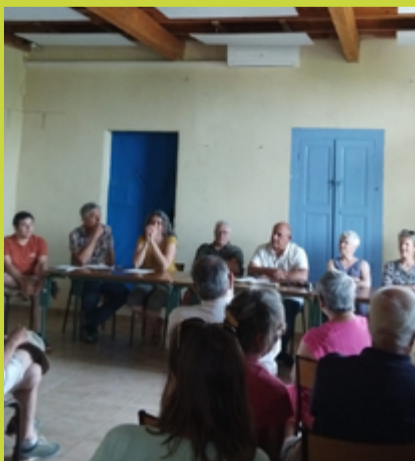
Réunion publique en juin