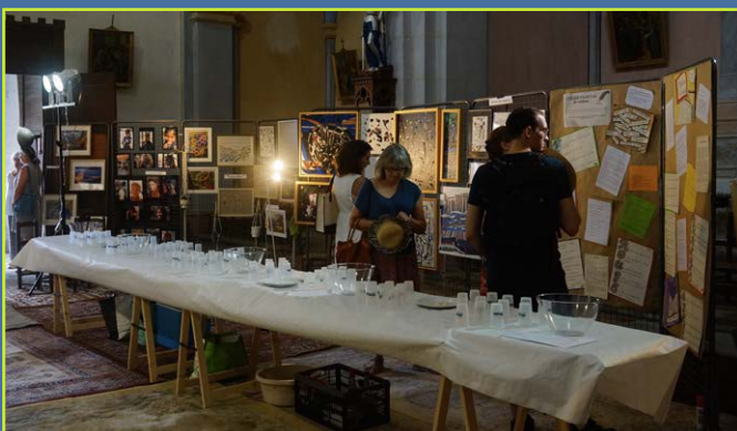
Expositions des artistes