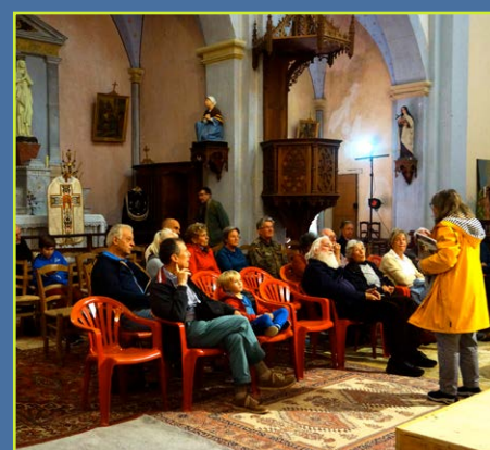
Journées du patrimoine