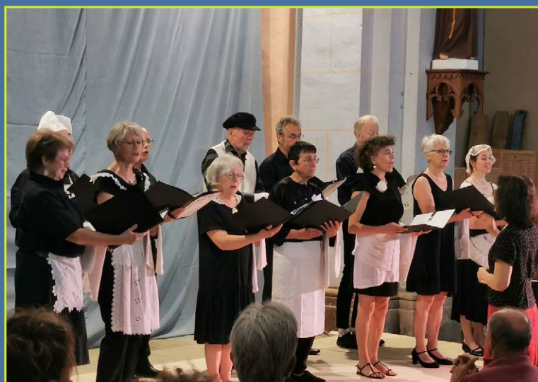
Concert dans l'église