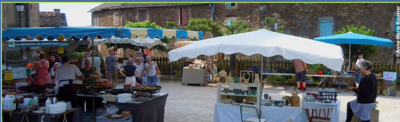
Le marché estival