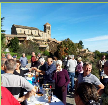
17 ème Foire de Malbosc