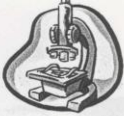
TABLEAU DES VACCINATIONS