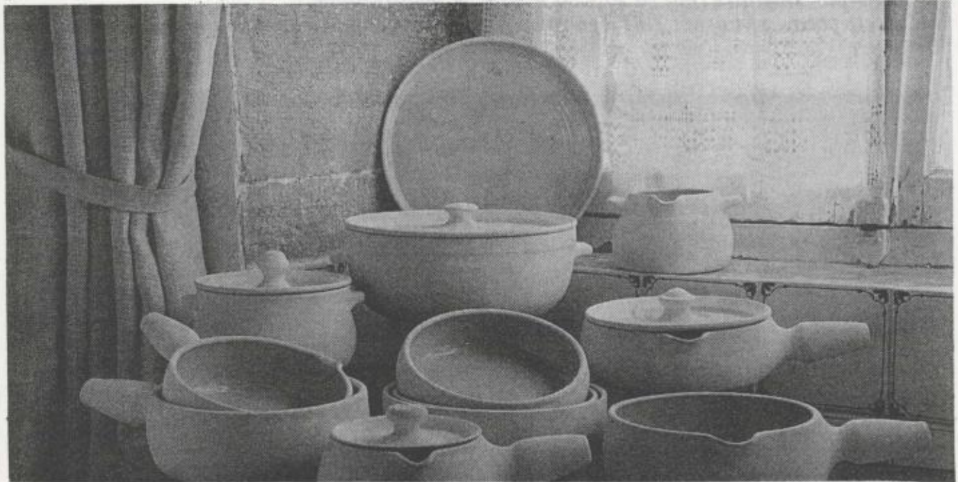
Les poteries de Claude Trifigny sont avant tout fonctionnelles. Mais, cela n'empêche pas de trouver des œuvres superbes.

Claude Trifigny a choisi cet endroit de verdure pour créer et trouver par la même son équilibre